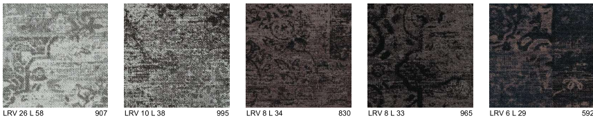
LRV 26 L 58 907 LRV 10 L 38 995 LRV 8 L 34 830 LRV 8 L 33 965 LRV 6 L 29 592