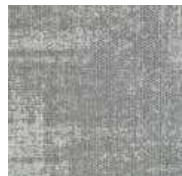
LRV 23 L 55 907