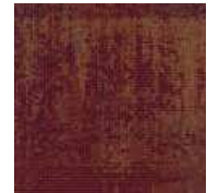
LRV 8 L 33 351