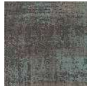
LRV 17 L 48 610