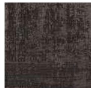
LRV 6 L 29 830