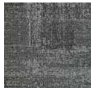
LRV 11 L 39 995