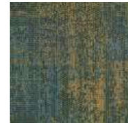
LRV 10 L 38 668