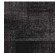
LRV 5 L 27 965