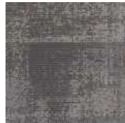
LRV 16 L 47 957