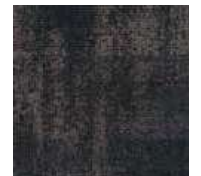
LRV 7 L 32 592